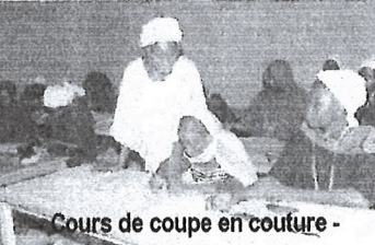
Cours de coupe en couture -