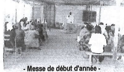
- Messe de début d'année -