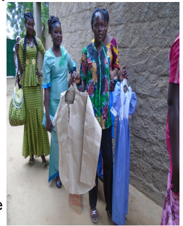
Défilé de mode au Centre - Cours de couture -