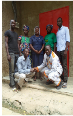
Personnel du Centre

"Grand bonjour de N'Djaména et un chaleureux merci pour tout le travail effectué et l'aide que vous apportez à la vie du Centre ici. Que Dieu vous bénisse et continue à vous soutenir dans votre apostolat.