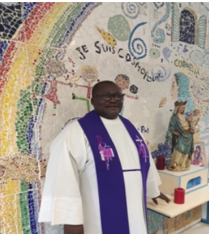
Célébration de l'Avent à de Maillé

C'est un ministère que je prends très au sérieux et qui porte des fruits silencieux ». En ces termes presque chuchotés, le père annonce sa mission au milieu de la communauté éducative de Maillé.